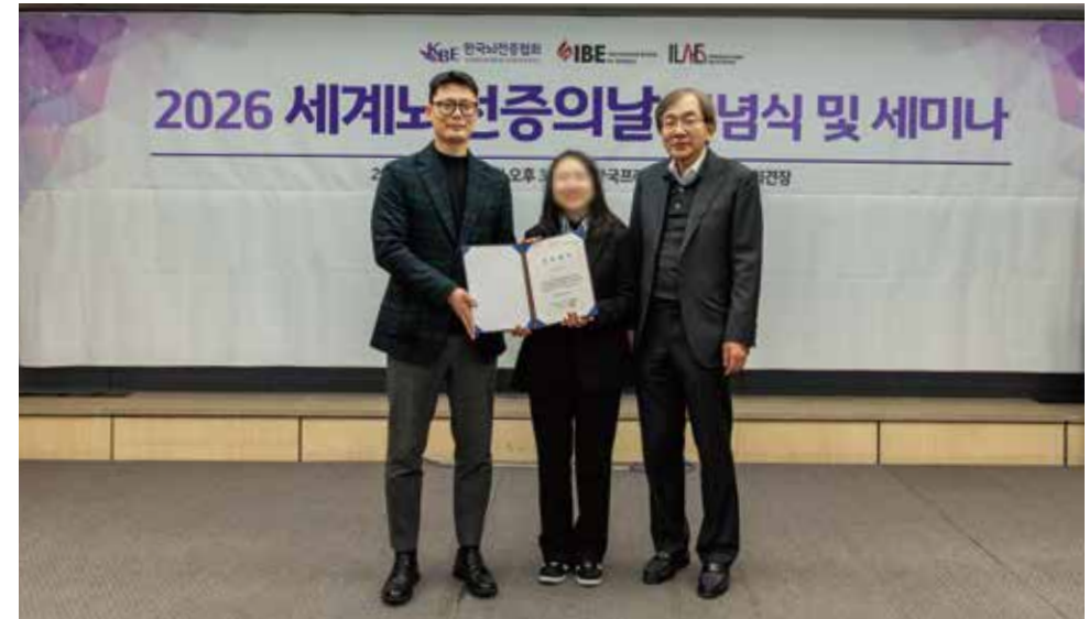
남양유업 임직원 장학금을 수여 받은 카이스트 4학년 학생

장학금은 뇌전증 환우들이 건강상의 제약이나 환경적 어려움으로 인해 학업을 중단하지 않도록 학업 지속과 자립 역량 강화를 위해 쓰일 예정이며, 올해 첫 장학금은 카이스트 4학년에 재학중인 학생에게 전달되었습니다.