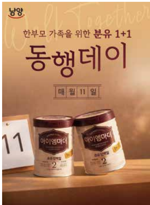
2026 남양 네이버 브랜드 스토어 동행데이

지난해 큰 호응으로, 전국 한부모가족복지시설에 약 1,350여 캔의 분유를 후원했던 '한부모 가족을 위한 동행데이' 캠페인이 이번 3월부터 12월까지 남양 네이버 브랜드 스토어를 통해 재진행 됩니다.