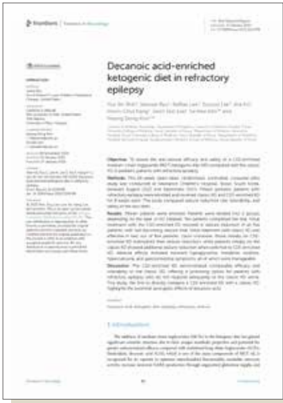
C10 성분 강화 연구 논문

C10 성분 강화 케토니아는 기존 제품에 사용했던 올리브유 성분을 발작 감소 및 항경련에 도움을 주는 MCT 오일로 변경한 것이 특징으로, 남양유업 연구진과 세브란스병원 공동연구진을 통해 개발되었습니다.