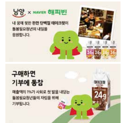
2026 네이버 해피빈 굿브랜드 캠페인