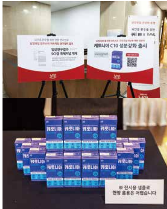
세계 뇌전증의 날 기념식에서 공개된 '케토니아'